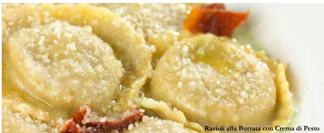
Ravioli alla Burrata con Crema di Pesto