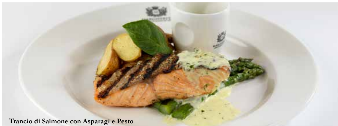
Trancio di Salmone con Asparagi e Pesto