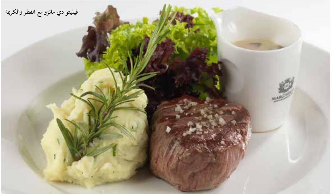
فيليتو دي مانزو مع الفطر والكريمة