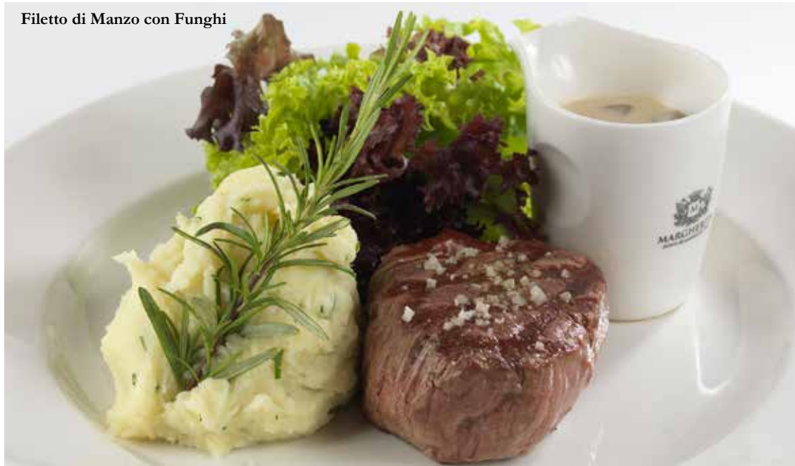
Filetto di Manzo con Funghi