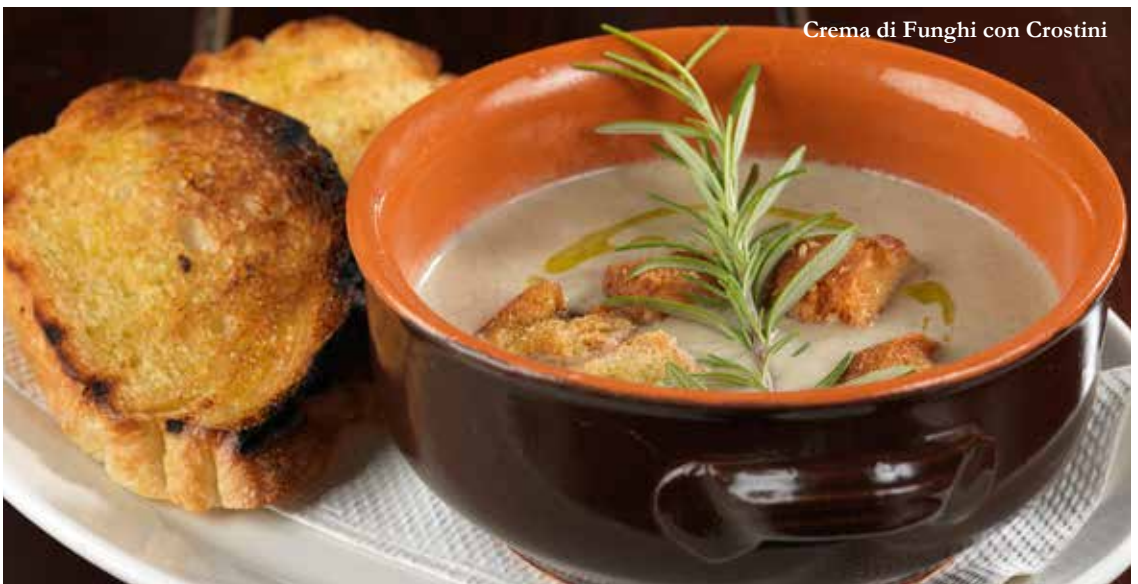
Crema di Funghi con Crostini

Sautéed diced eggplant with cherry tomatoes, creamy goat cheese and ricotta salata