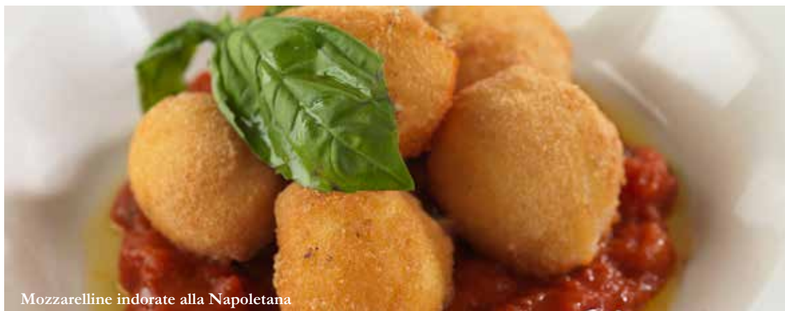
Mozzarelline indorate alla Napoletana