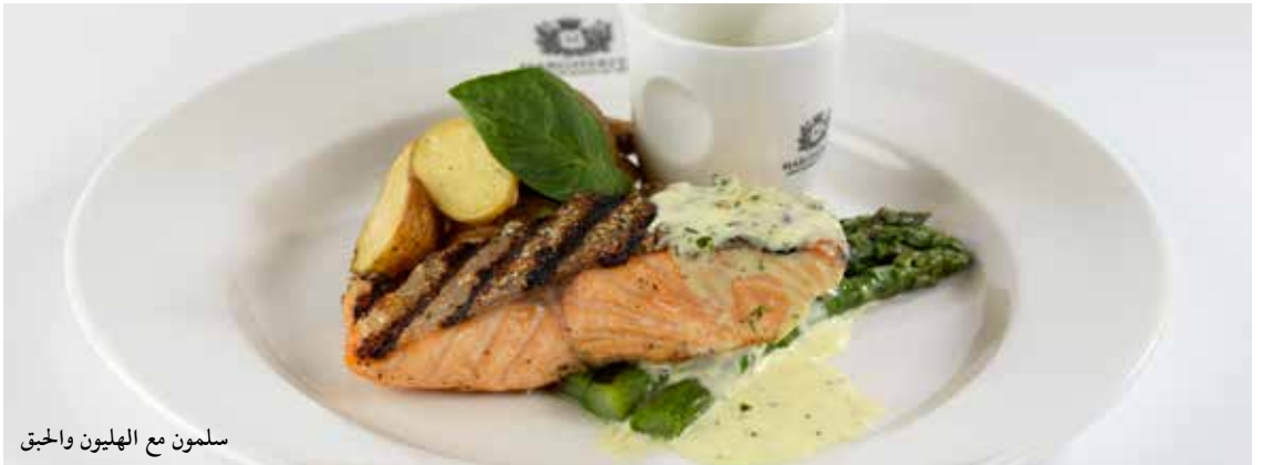
سلمون مع الهليون والحبق

سلمون مع الهليون والحبق سمك سلمون فيليه مشوي يقدم مع الهليون ، بطاطا وصلصة الحبق